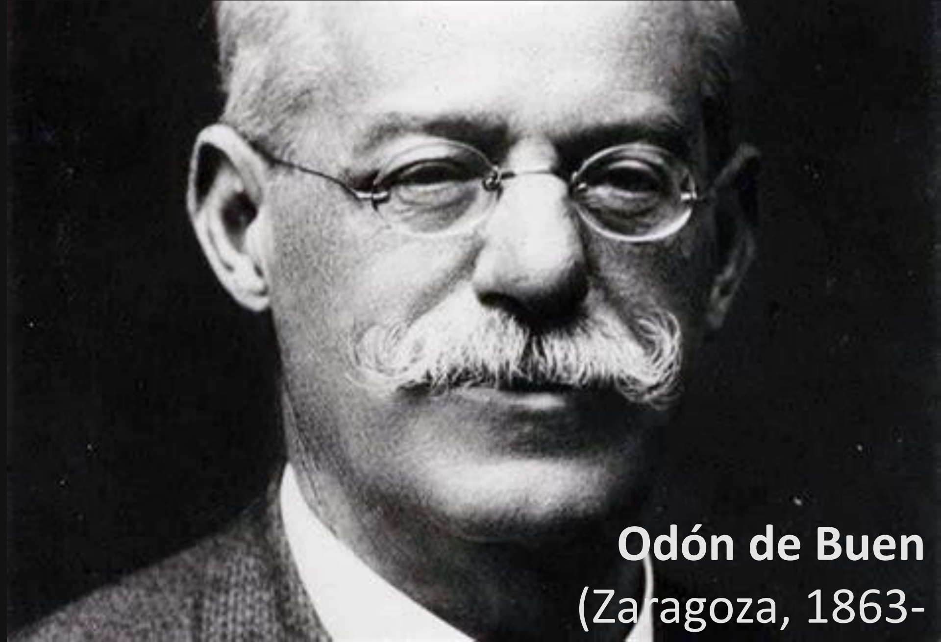
Odón de Buen (Zaragoza, 1863- Mèxic, 1945)