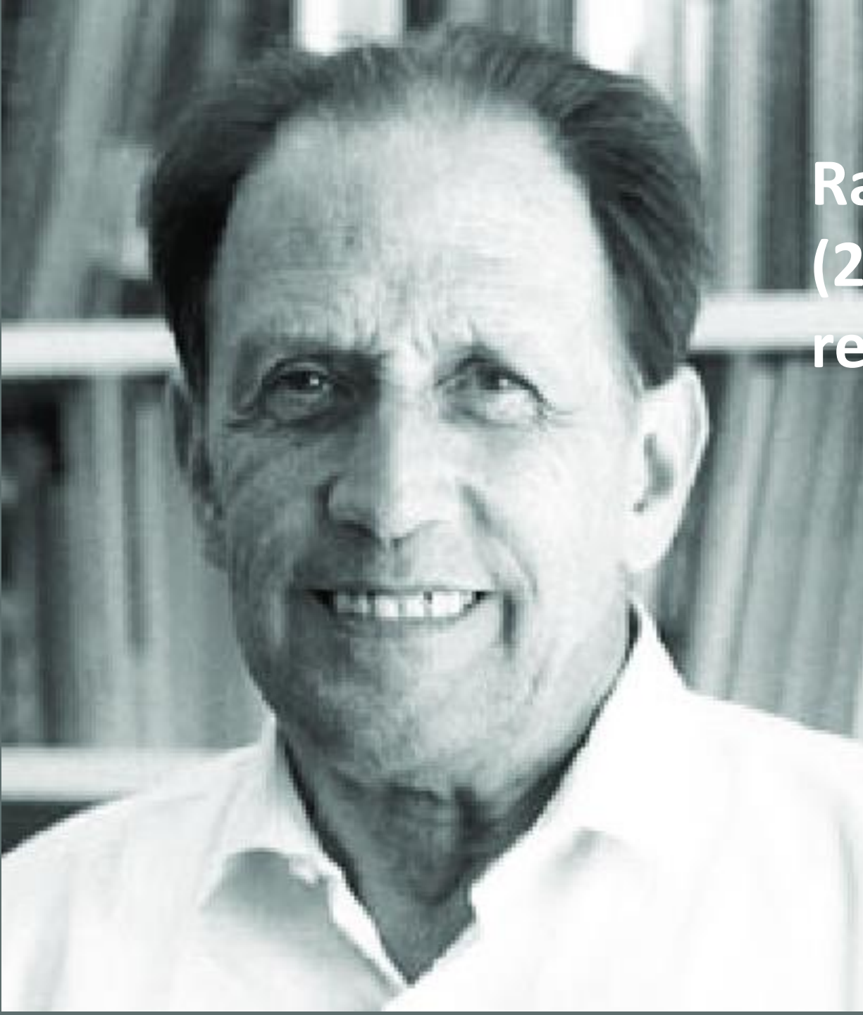
Ramon Margalef (2019-2004) recerca